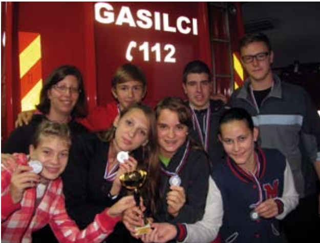
Udeleženci regijskega tekmovanja v gasilski orientaciji