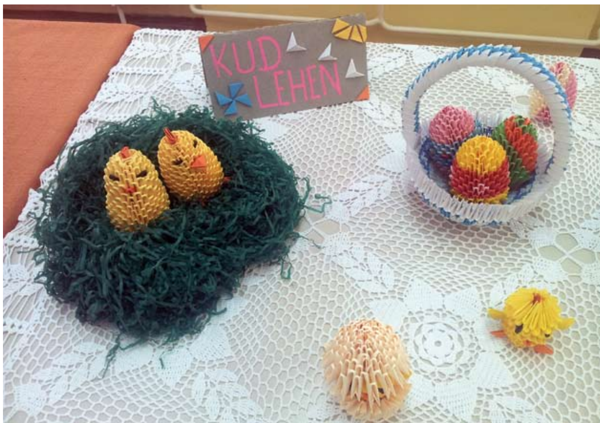
Izdelki z origami tehniko