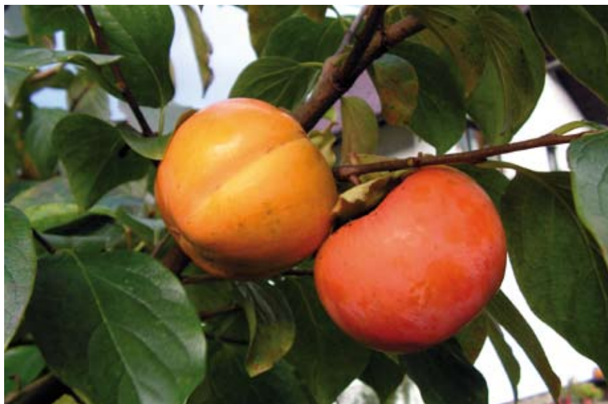
Plodovi kakija ob hiši Slavke Ropret v Breznu