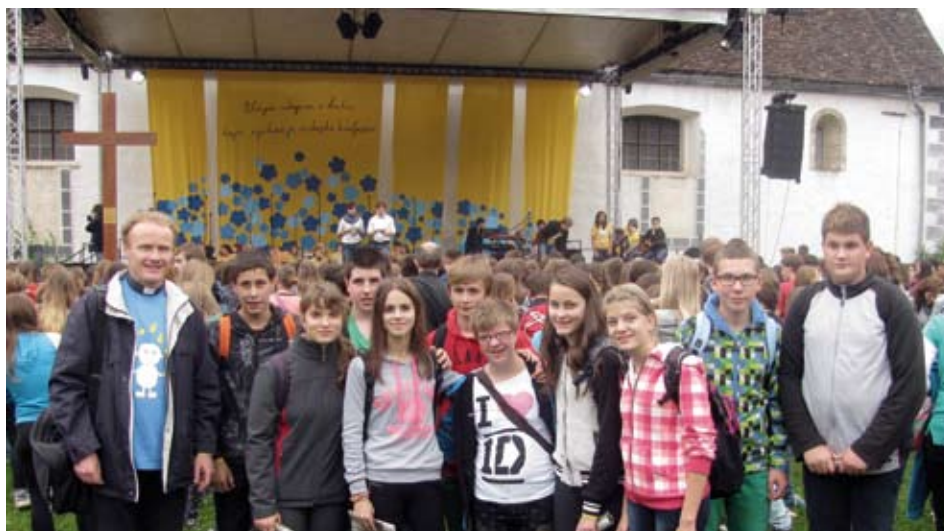
Birmanci obeh župnij so se udeležili Stične mladih, festivala mladostne vere