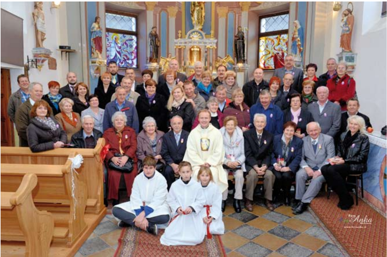
V Ožbaltu je potekalo srečanje zakonskih jubilentov župnij Kapla in Ožbalt

Zaradi pomanjkanja duhovnikov gre danes življenje župnij v smeri sodelovanja in povezovanja na medžupnijski prostor. Povezanost župnij Kapla, sv. Ožbalt, Brezno in Remšnik smo uresničevali med drugim tudi pri izvedbi oratorija in na romanjih. Izvedli smo enodnevno romanje na Brezje, ko smo se spomnili 200. obletnice podobe Marije Pomagaj. Na štiridnevem velikonočnem romanju v Medjugorje pa smo si gledali kraj Marijinega prikazovanja, prisluhnili nekaterim pričevanjem in bili deležni še mnogih duhovnih spodbud. Med mnogimi dogodki in dogajanji v župnijah v zadnjem letu naj posebej omenim samo dve stvari, in sicer izbiro članov novega župnijskega pastoralnega sveta (ŽPS) in obnovo oltarjev. Izbiro (volitve) članov za nov sestav aktivnih in zavzetih članov, ki se zgodi vsakih 5 let, smo izvedli 1. marca 2015.