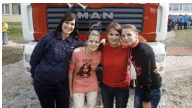
Udeleženske državnega tekmovanja skupaj z mentorico