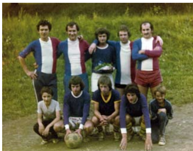
Ekipa iz leta 1975 v »klubskih« barvah