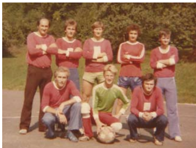
Ekipa v »novih« dresih na novem asfaltnem igrišču v Ožbaltu