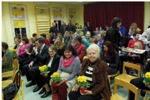
Prireditev ob materinskem dnevu (Foto: Borut Končnik)

Želimo si, da bi nam vse zastavljeno uspelo realizirati ali še bolje, morda narediti še kaj več.