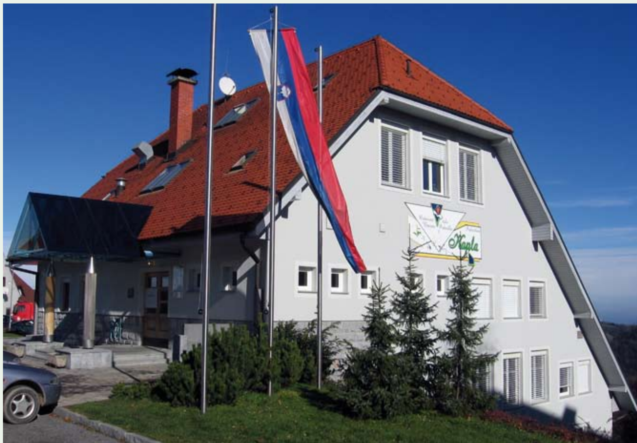
V centru vasi že 15 let stoji nova šola, na katero smo zelo ponosni