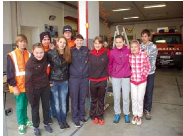
Na gasilskem kvizu se ocenjuje teoretično in praktično znanje